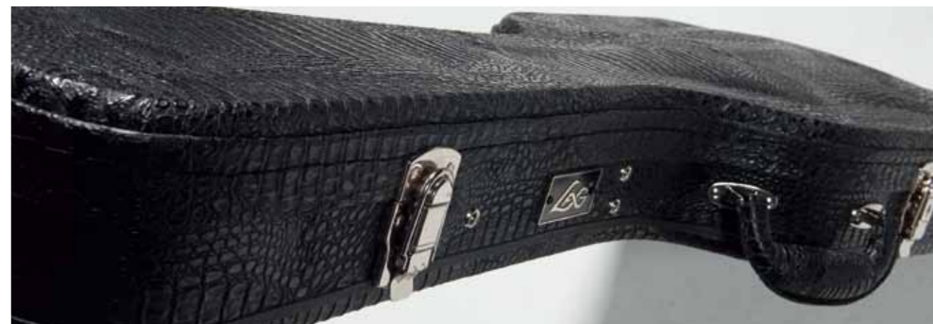
Chaque guitare est livrée dans un magnifique "Crococase".